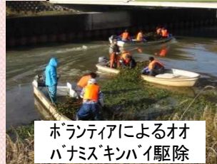
ボランティアによるオオハナミスギンバイ駆除