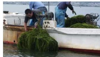
水草刈取(根こそぎ除去)